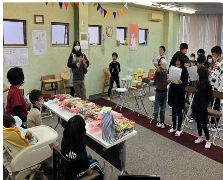
(卒園入学お祝いパーティー ②)