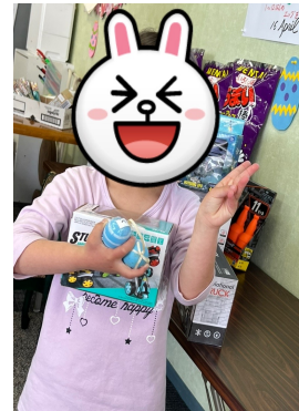
(エッグハンティング ③)